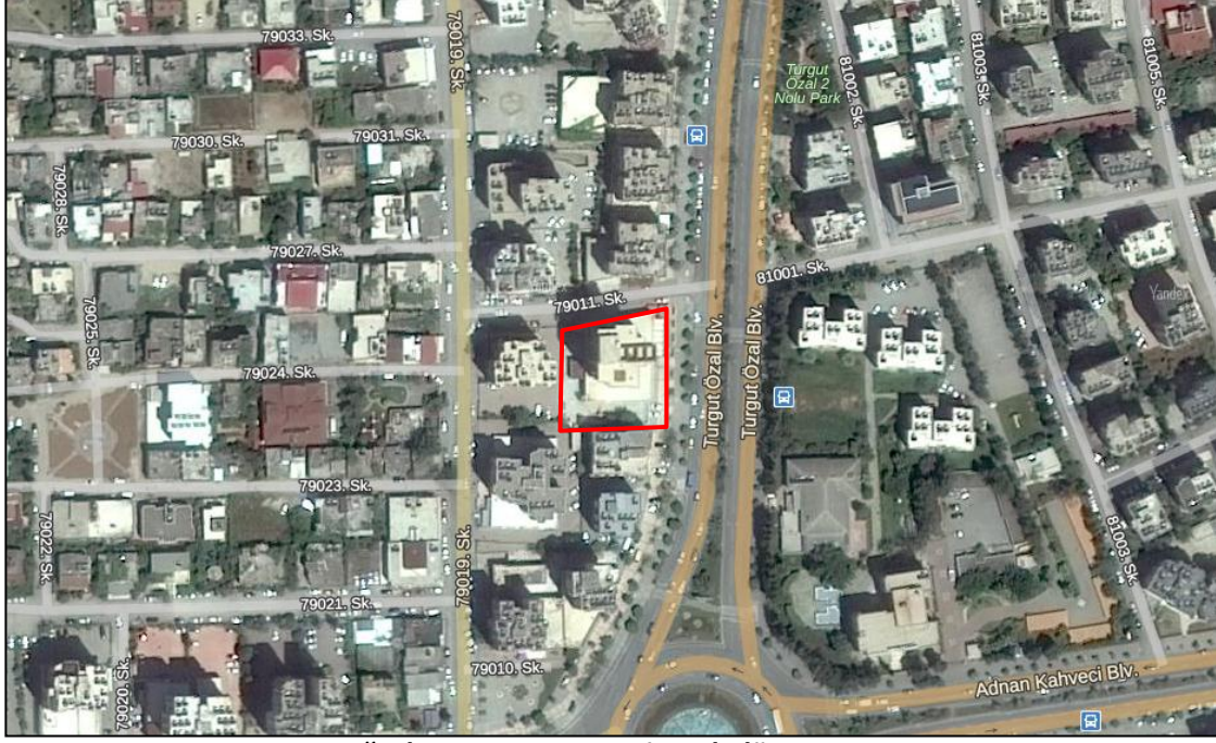
Değerleme Konusu Gayrimenkulün Konumu